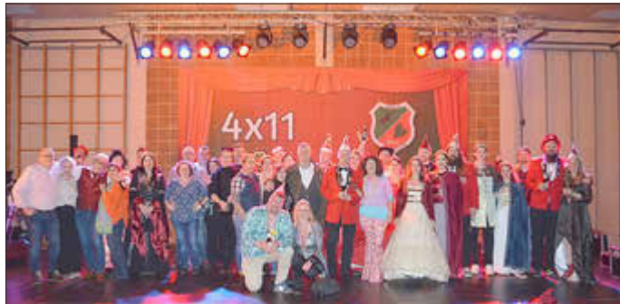
Zahlreiche ehemalige Prinzessinnen und Prinzen waren zu Gast.