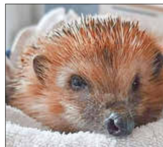
Veranstaltungsort: NABU-Naturgarten, Tor 4, Losheim am See, Zum Stausee 199 Treffpunkt: Tourist-Info

Dazu referieren Frau Nobbe und Frau Franz, die beide eine Auffangstation für Igel betreiben. Sie werden über die diesjährige Not-Situation in der Igelpflege berichten und anschaulich darstellen, wie man Igel einfach und effektiv bei der Vorbereitung auf den Winterschlaf unterstützen kann.