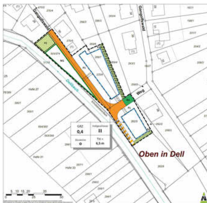
Lageplan Geltungsbereich ohne Maßstab