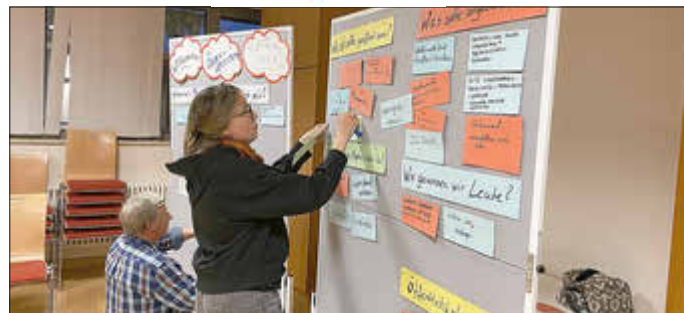
Viele Ideen und Anregungen wurden an der Pinnwand gesammelt

Hier wurden am Ende verschiedenen Aufgaben verteilt und nach den Herbstferien soll ein nächstes Treffen stattfinden.