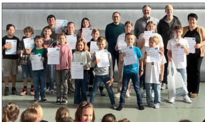
Urkundenübergabe in der Grundschule Wahlen

Das Team der RSG-Hochwald erreichte ebenfalls mit 15 aktiven Radelnden im Ringen um die meisten Teamkilometer mit 3.717 den dritten Platz hinter der Gemeinschaftsschule und dem offenen Team Losheim. Das Team „Radhaus“ der Gemeindeverwaltung schaffte es dieses Jahr erneut auf den 2. Platz bei der Anzahl der aktiv Teilnehmenden und lieferte sich mit dem Team der Grün Alternativen Liste ein bis kurz vor Ende spannendes Duell um den vierten Platz der meisten Team-Kilometer. Über alle Teamgrenzen hinweg gab es aber auch insgesamt acht Teilnehmende, die im dreiwöchigen Aktionszeitraum mehr als 500 Kilometer geradelt sind, darunter sogar vier mit mehr als 1000 Kilometern, mehr als sportlich! Es gibt zwar keine direkte Ortsteilwertung, aber mit der Grundschule, dem Team des Turnvereins und auf weitere Teams verteilte Teilnehmende war der Ortsteil Wahlen sehr stark vertreten.