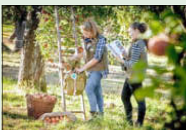
Naturerlebnis auf der Streuobstwiese, Foto: Naturpark/Brigitte Krauth

Zum Naturpark-Jubiläum bietet der Naturpark einen „Tatort Natur Quiz“ an. Unter allen richtigen Einsendungen werden 40 spannende Heimat-Forschertage an Schulklassen, Kinder- oder Jugendgruppen aus Naturpark-Verbands-/Gemeinden verlost. Mit einem/einer Naturpark-Referenten/in geht es z. B. auf abenteuerliche Fledermaus-Safari, auf spannende Entdeckungsreise in die Welt der Krabbeltiere, auf erlebnisreiche Tour zu unseren Gewässern oder zu einer aufregenden GPS-Tour.