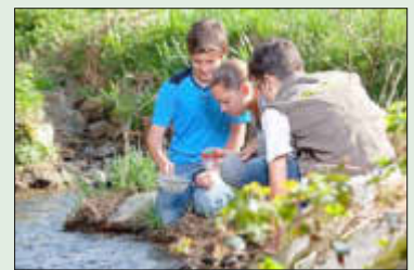
Kinder erforschen den Bach

Der Naturpark Saar-Hunsrück ist ein spannender Lern- und Erfahrungsort. Um den Kindern die Natur- und Kulturlandschaft ihrer Heimat erlebnisorientiert näherzubringen und sie für den Erhalt der biologischen Vielfalt zu begeistern, führt der Naturpark ganzjährig vielfältige Bildungsangebote zum Naturerleben und Erforschen in Zusammenarbeit mit dem Netzwerk der Naturpark-Kitas/-Schulen und den Bildungseinrichtungen und außerschulischen Kooperationspartnern durch.