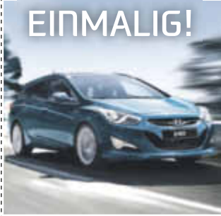
Hyundai i40 Trend 1,7l CRDi, 85 KW / 116 PS

Klimaanlage, Sitzheizung, Bluetooth, Anschlüsse für USB und AUX, CD-Radio mit MP3-Funktion