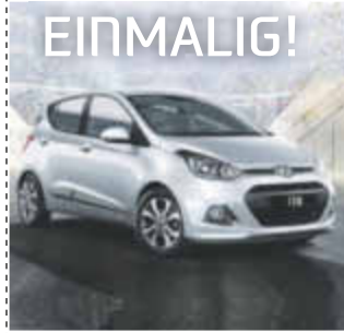
Hyundai i10 Classic 1,0l, 49 KW / 67 PS

Klimaanlage, Anschlüsse für USB und AUX, CD-Radio mit MP3-Funktion, ZV, Reifendruckkontrollsystem, Metallic-Lackierung