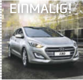
Hyundai i30 Soko 1,4l, 74 KW / 100 PS

Klimaanlage, Anschlüsse für USB und AUX, CD-Radio mit MP3-Funktion, ZV, Reifendruckkontrollsystem, Sitzheizung, Metallic-Lackierung