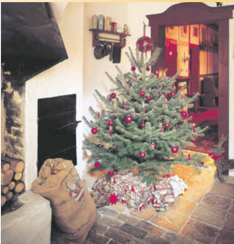
So sieht es bald wieder in vielen deutschen Wohnstuben aus: Eine wunderschön geschmückte Nordmanntanne mit darunterliegenden Geschenken.