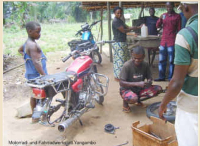
Motorrad- und Fahrradwerkstatt Yangambo

Und so wird es Zeit, Abschied zu nehmen von „Keba Sida“ und Zeit für einen Nachfolger. Auch wenn sich der Preis inzwischen verdoppelt hat, die Waldbauernselbsthilfe wünscht sich wieder eine „Yamaha AG 100“: das Motorrad mit Kettenschutz ist optimal an die anspruchsvollen Regenwaldpisten angepasst. Für Adaptationen und Reparaturen gibt es viel Material und know-how vor Ort. Gekauft werden kann das stabile Gefährt in der kongolesischen Hauptstadt Kinshasa. Samt einigen wichtigen Ersatz/Verschleissteilen und Reparaturmaterial - denn im Wald wollen die Reisen gut vorbereitet sein. Unverhofft kommt allzu oft. Und Bestellungen aus der Hauptstadt sind bisweilen Monate unterwegs. Damit auch das neue Motorrad lange seinen Dienst tun kann, muss es fachmännisch eingefahren und gewartet werden. Für den Treibstoff und manches andere sorgen die Waldbauernfamilien dann selber. Sie geben was sie können, da sie die helfende Hand, den Rat und die treue Begleitung sehr schätzen. Helfen Sie mit, dass die Menschen im Regenwald ihre Lebensgrundlage bewahren und ihren Kindern eine bessere Zukunft ermöglichen können. Das Projekt hat die Nummer 49813, Bilder und noch mehr Infos gibt es auf der Spendenplattform www.meine-hilfe-zaehlt.de und auch persönlich am Wochenende an der Kongo-Ausstellung auf dem Losheimer Weihnachtsmarkt in der Eisenbahnhalle.