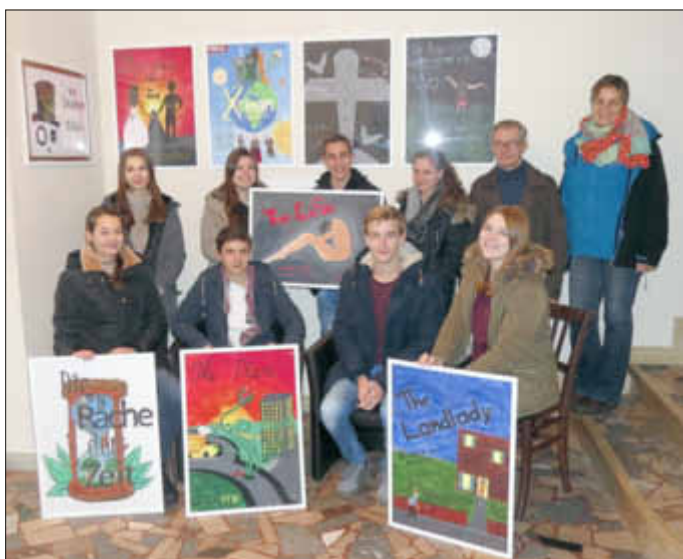
Schüler der PDG mit ihren Plakaten sowie zwei Vertreter des Vorstandes der Filmfreunde Losheim e.V.