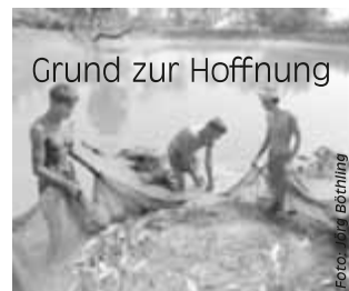
Grund zur Hoffnung