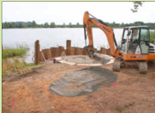
Blick auf den Grillplatz

In Kooperation zwischen dem Globus Losheim, dem Globus-Baumarkt, der Firma Meiers und der Gemeinde Losheim am See entsteht zurzeit ein Globus-Gemeinschaftsgarten mit Gartenhäuschen und Grillplatz in direkter Ufernähe im SeeGarten am Stausee Losheim.