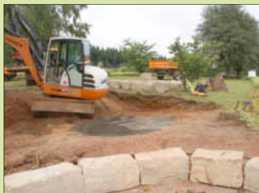
Bauarbeiten im Globusgarten