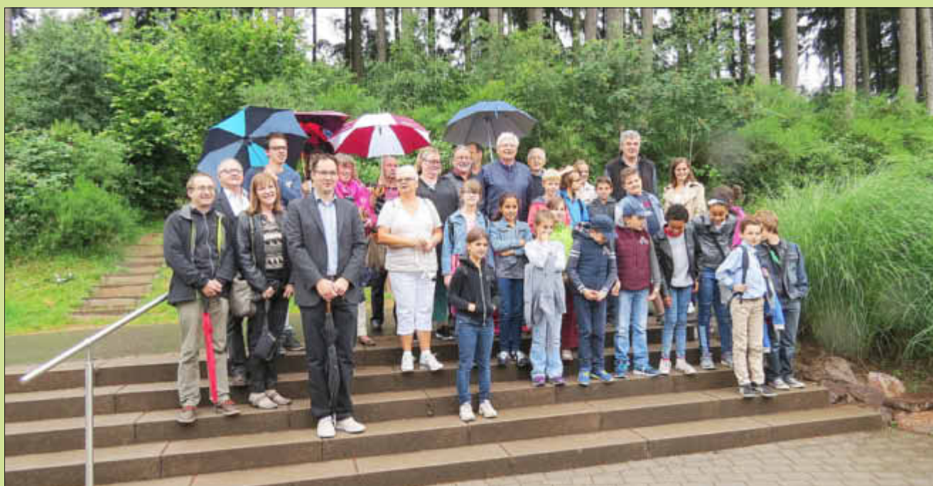
Besucher und Gastgeber am SeeGarten