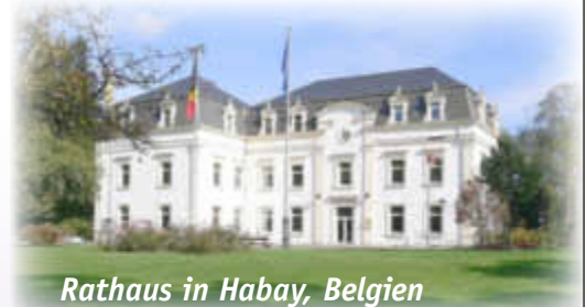
Rathaus in Habay, Belgien