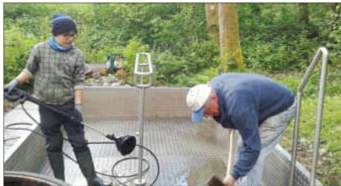
Jüngster und erfahrenster Helfer am Werk

frischt. Dafür möchte ich allen Helfern meinen Dank aussprechen. Beim Wiederbefüllen des Tretbeckens wurde die Anlage auch schon durch eine Wandergruppe in Betrieb genommen, dies war eine schöne Belohnung für die getane Arbeit.