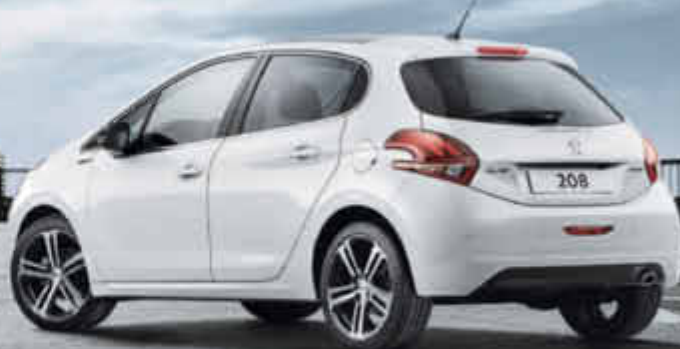
Abbildung zeigt 5-Türer