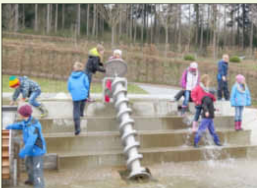
Kinder der Grundschule Losheim auf dem Wasserspielplatz

April bis Mai täglich 11 bis 18 Uhr, Juni bis August täglich 10 bis 20 Uhr, September bis Oktober täglich 11 bis 18 Uhr; November bis März täglich 11 bis 17 Uhr. Bei gutem Wetter verlängern sich an Sonntagen die Öffnungszeiten um eine Stunde.