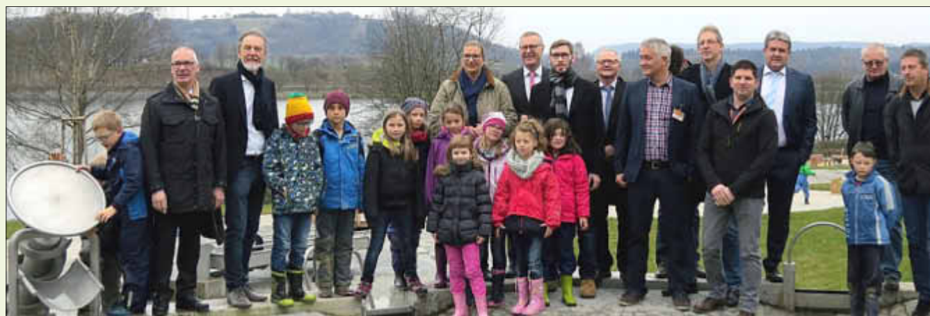
Ministerin Anke Rehlinger, die Sponsoren des SeeGartens, Vertreter der ausführenden Firmen, der Gemeindeverwaltung und die Kinder der Grundschule Losheim