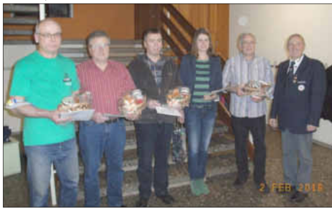
Spendejubilare in Losheim