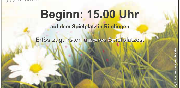
M. Braun | www.realtor.de